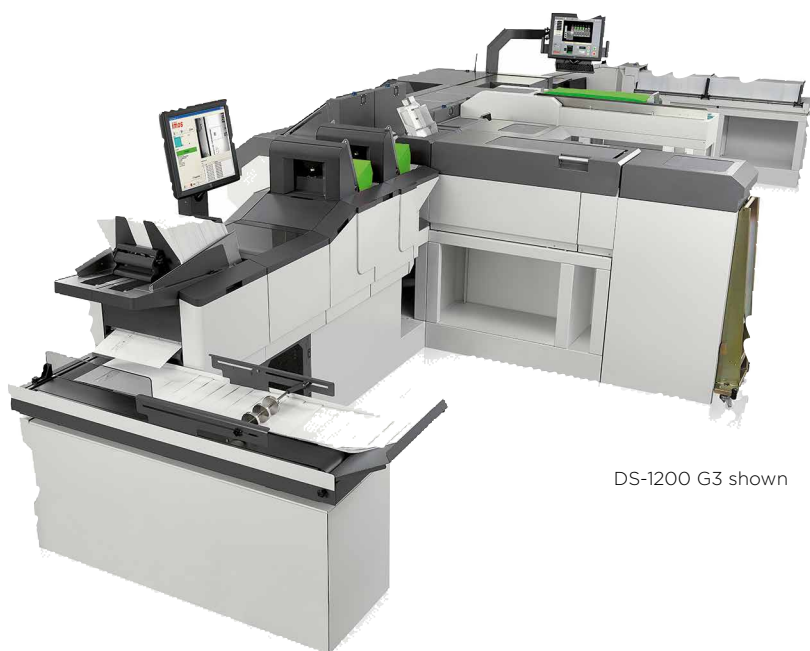
DS-1200 G3 shown